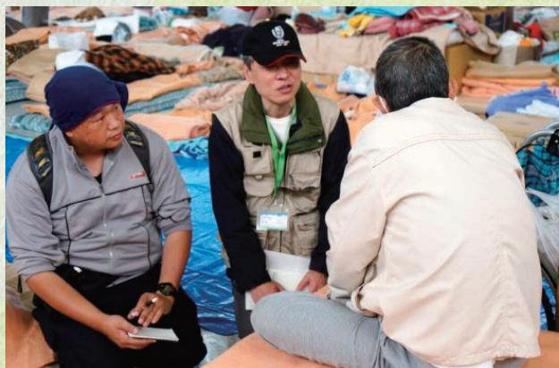
被災された方のお話を聞き、ニーズを確認します