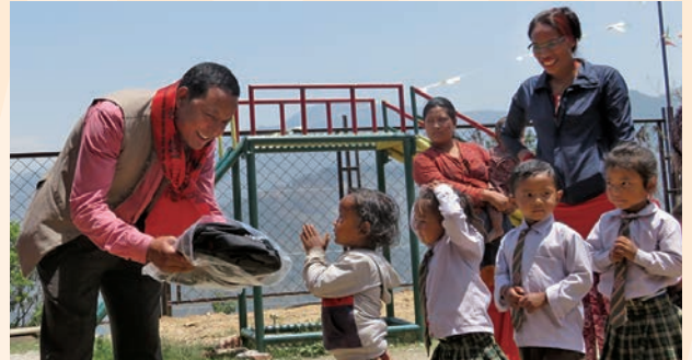
学用品セットを受けとる子どもたち

〈送付先〉〒167-0041 東京都杉並区善福寺2-17-5 チャイルド・ファンド・ジャパン ハガキ係宛