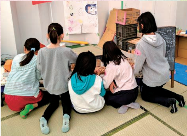
避難所の遊び場の様子

子どもたちがのびのびと遊べる場所を準備するとともに、受験を控えている子どもたちが静かに集中して勉強できる場所の確保も必要でした。そこで、避難所の中にあつた倉庫を片付け、学習スペースを確保しました。それまでは、話し声がする避難所の床やダンボールベッドを使って勉強していましたが、学習スペースが設置されてからは落ち着いて勉強することができるようになりました。「机と椅子があり、暖房も効いているところで勉強できるようになり、本当によかった！」と子どもたちから喜びの声も届きました。