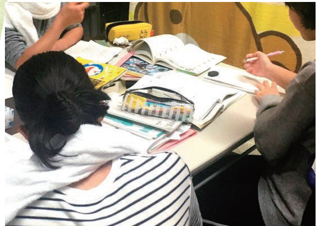
学習スペースで勉強する子どもたち