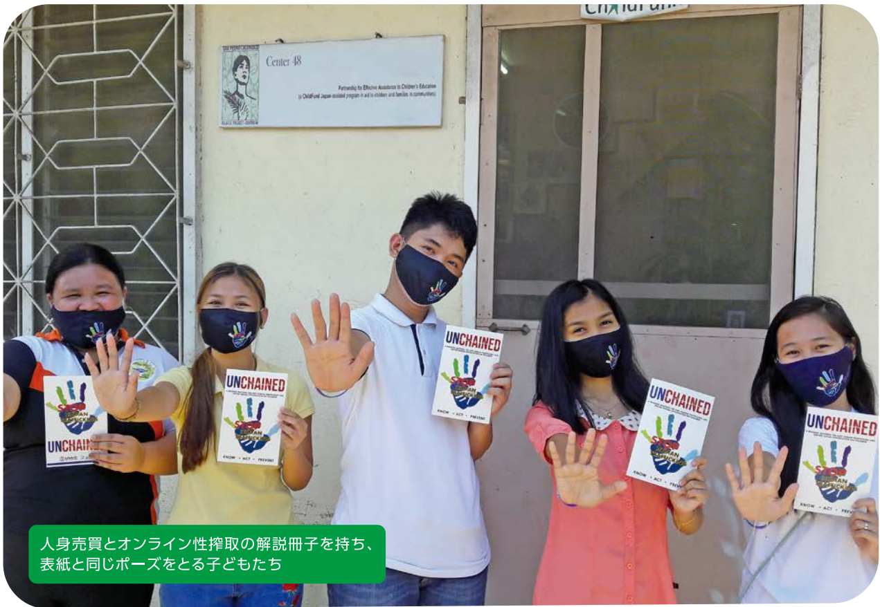
人身売買とオンライン性搾取の解説冊子を持ち、表紙と同じポーズをとる子どもたち