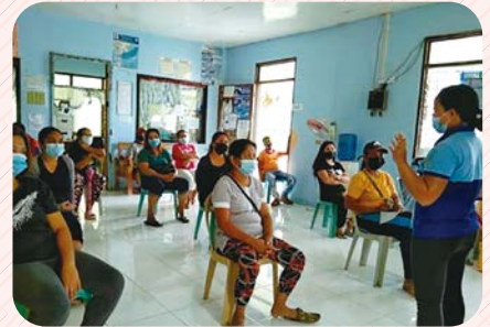
ワクチンについて説明を受ける保護者たち

現地では、感染予防、家庭学習支援を続けるとともに、ワクチン接種の説明会なども行っています。