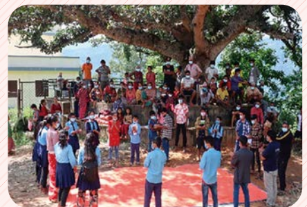
「子どもの保護方針」を 地域住民に劇で伝える子どもたち

休校となっていた学校は、ロックダウンの解除とともに再開し、子どもたちを集めた研修や子どもクラブの集まりなども行えていましたが、現在は再び休校となっています。