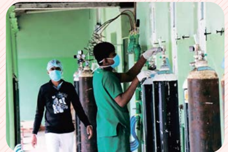
地域の病院の医療体制支援も行っている

支援活動は継続していますが、職業訓練を担当する団体が活動を自粛してしまう、子どもが集まる活動について、感染を恐れた保護者が参加させないなど、活動の実施に困難が生じています。