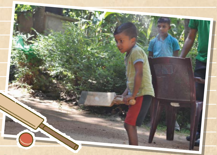
クリケットは男の子に大人気のスポーツ