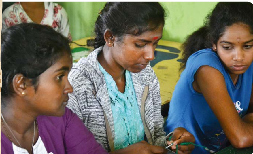
「私も自分のお店をもちたい。」多くの女の子がそう話してくれました

このように、ユースは、就業支援といった支援を「受ける」対象であると同時に、コミュニティー・キッチンやガーデンの運営など、支援の「担い手」としても活躍しているのです。チャイルド・ファンドの支援に支えられながら、ユース、そして地域住民が力を合わせて、この経済危機を乗り越えようとしている。そんな姿を随所で見る事ができた今回の視察でした。