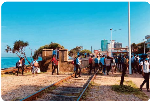
ホームから線路を横断して出ていくのもスリランカでは当たり前の日常

3月20日。10時間のフライトを経て到着したスリランカは、最高気温30度前後。街では、客を乗せたバイクタクシー、アジアでよく見かけるトゥクトゥク ※1 が、クラクションを鳴らしながら勢いよく走り抜けていきます。小さな食堂では人々がカレーを食べ、商店の店先では洗濯ばさみに吊り下げられた宝くじに人が集まります。初めてスリランカを訪れる私は、「これがスリランカの日常なんだな」と、わくわくしながら眺めていました。