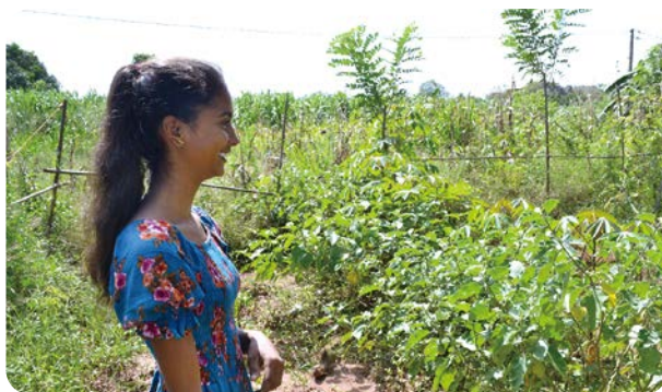
自宅につくった家庭菜園を案内してくれたユースの女の子