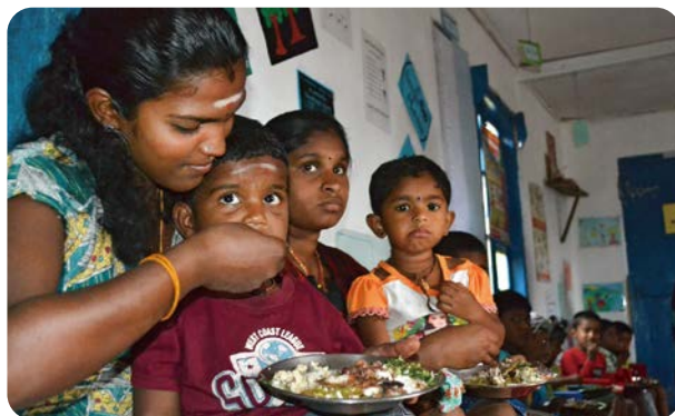
提供された食事を食べさせるお母さん

また、コミュニティー・キッチンが行われている建物のすぐわきには、コミュニティー・ガーデンと呼ばれる地域菜園がありました。地域のユースが運営を担い、野菜などを育てています。収穫された野菜は、コミュニティー・キッチンの食材として活用されるだけでなく、一部は販売して収益化し、それを元手に次回の作物の種を購入しています。また、ここでの栽培の経験を生かして、自分の家で家庭菜園をつくったりもしています。