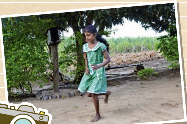
ケンケンパのような遊びも人気