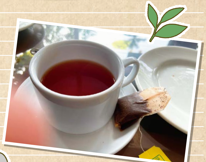
コーヒーも飲まれますが、やっぱり紅茶が人気