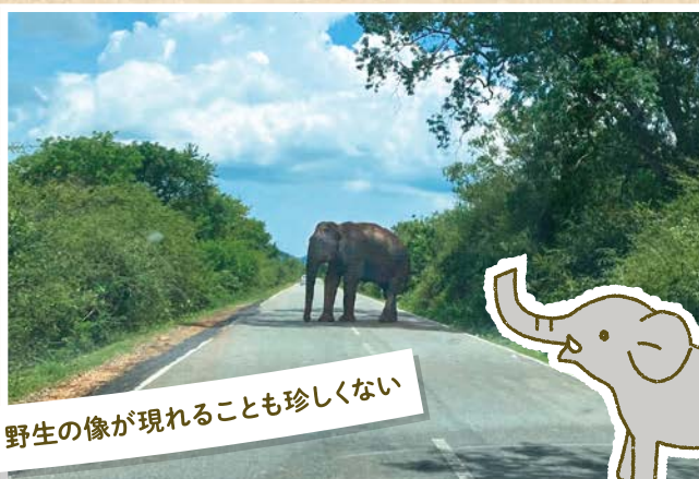
野生の像が現れることも珍しくない