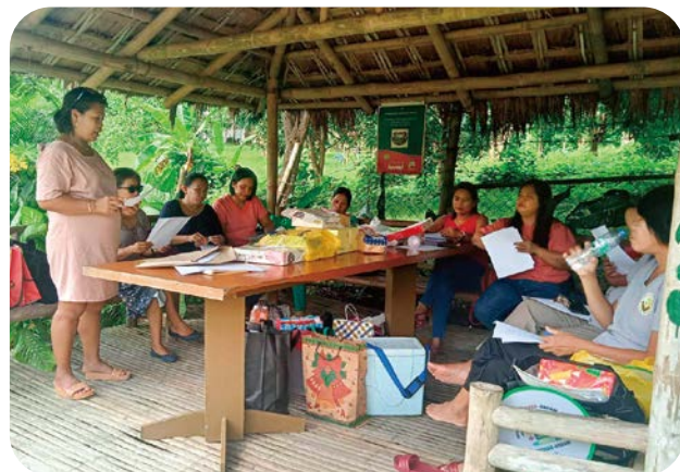
組織の運営について話し合う家族、地域住民のメンバー

さらに、家庭の収入向上や住民主体の組織づくりの支援も行いました。子どもたちが中心となって設立した、メンバー270名のユース組織は、自分たちを取り巻く問題を考え、地域で積極的に活動しています。また、家族や地域住民400名以上で構成された住民組織は、地域住民の生活改善を目的とし、出資金を募り、小規模資金の貸付、ビジネスセミナーへの参加支援、ユース組織の活動支援等を行っています。持続可能な運営体制が整ったこの組織は、2020年、労働雇用省に正式登録されました。2つの団体は地域が支援から自立した後も、子どもの権利や保護の推進、家族・地域の生活改善に貢献する活動を担っていきます。