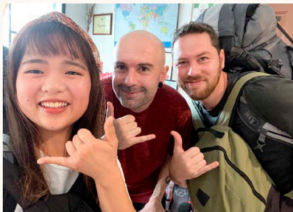
バックパッカー中、滞在先のゲストハウスで仲良くなった旅人とのショット。

幼少期から途上国支援のテレビやドキュメンタリーを観ていたことや、大学在学中の海外でのバックパッカー経験から、国際協力の仕事に携わりたいと考えていました。実際に働き、イメージを具