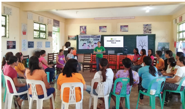
子どもと保護者の対話セッションの様子

現地では、教育、保健・栄養、子どもの権利啓発、防災などの分野で活動を行ってきました。中でも、教育は支援活動の中心であり、子どもたちへ学用品の支給を行ったほか、教育の大切さを理解してもらうことで、2014年～2024年の高校卒業率が99%となるなど、大きな成果をあげることができました。