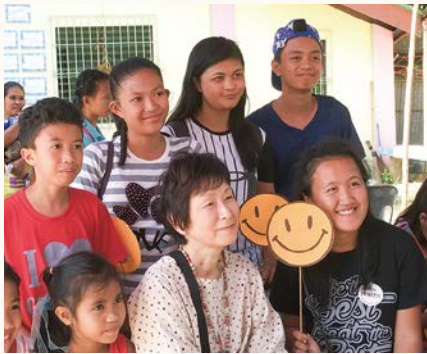
2017年のフィリピン訪問の旅にもご参加いただきました

翻訳ボランティアとして、スポンサーさんの手紙を英語に翻訳したり、現地のチャイルドの手紙を翻訳したりしています。時には、英文のレポートの翻訳など、少しかしこまった文章を翻訳することもあります。